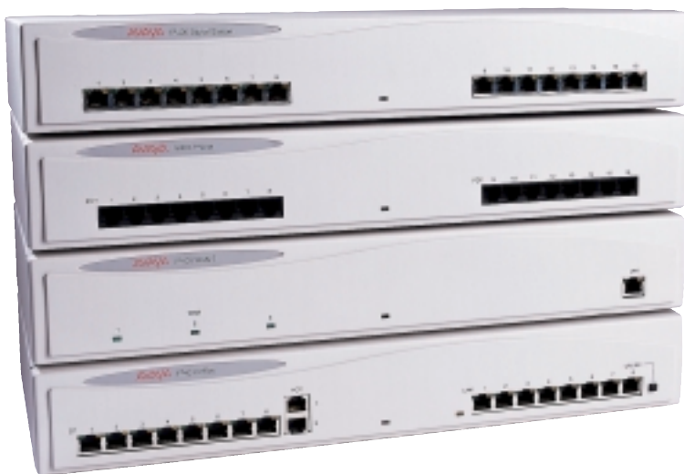
Стек IP 400