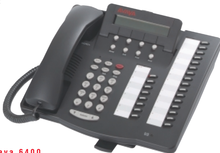
Телефонный терминал Avaya 6400